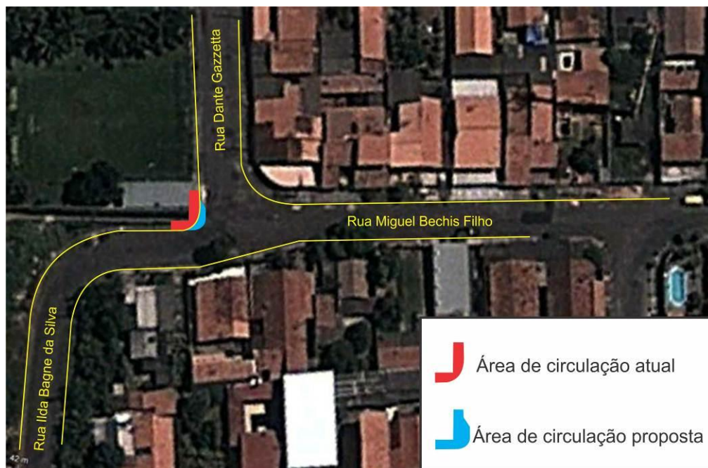
Imagem 1 – Sugestão para aumento da área de circulação no referido local.