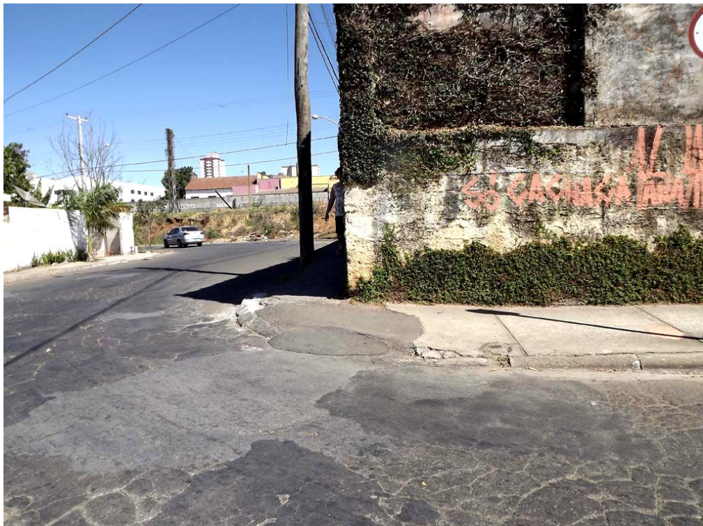
Imagem 4 – Pedestre não possui visão da rua e acidentalmente adentra seu leito carroçável.