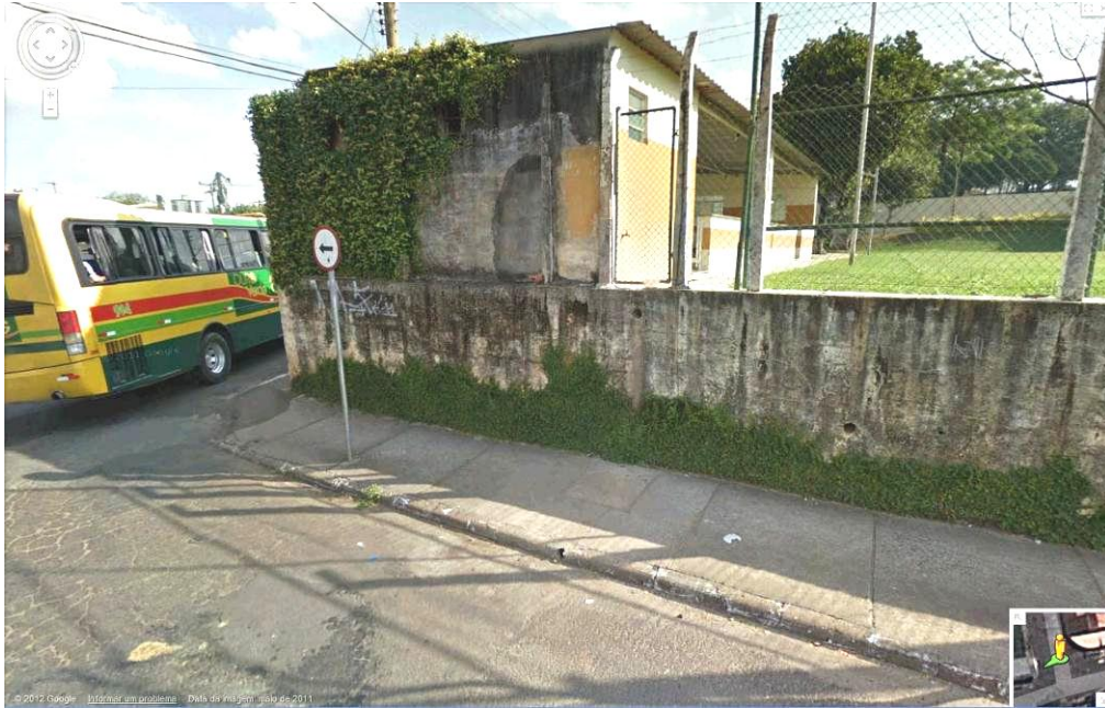
Imagem 3 – Veículos algumas vezes chegam a passar por cima da área de circulação.