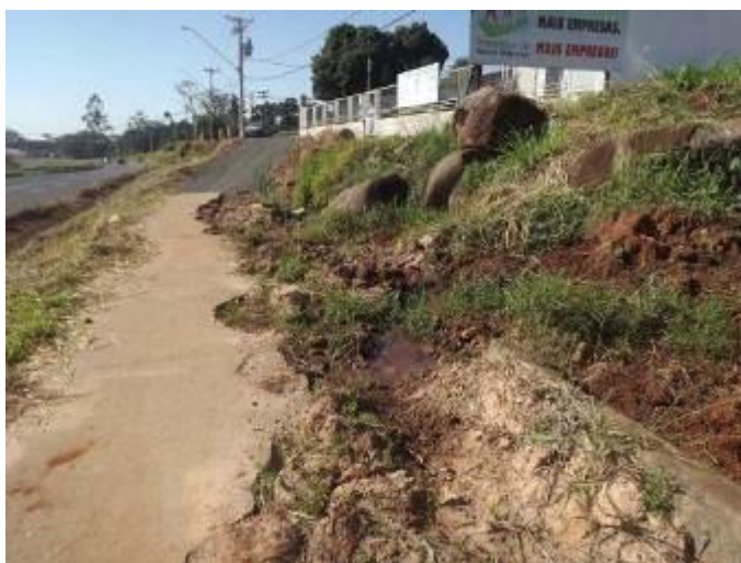
Imagem do local em questão. Ao fundo observa-se a colocação de pedras no local onde existia o passeio público.