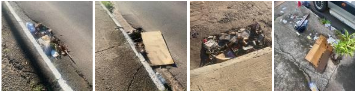
Nova Odessa, 14 de janeiro de 2024.

3. Existe algum plano de manutenção e limpeza periódica das ruas e bueiros do município, de modo a evitar o acúmulo de lixo e garantir o bom funcionamento do sistema de drenagem urbana? Se sim, solicito cópias dos cronogramas informando o dia e local realizado por semana.