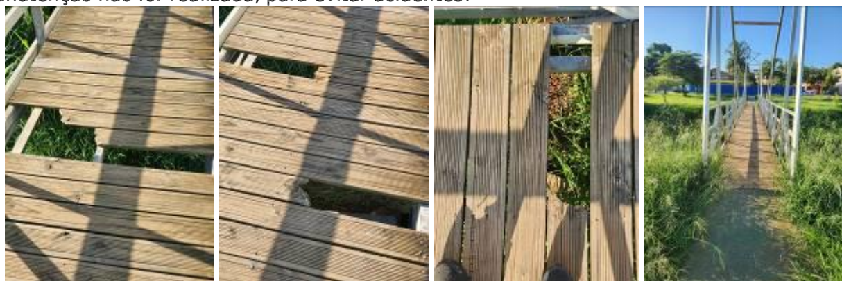
Nova Odessa, 13 de janeiro de 2024.