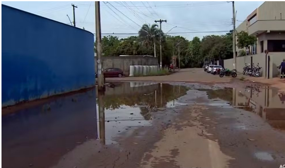
Nova Odessa, 29 de abril de 2026.