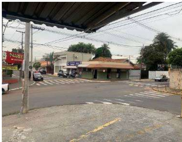
Imagem do local: