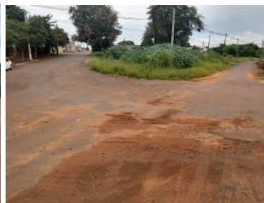
VIA DO PARQUE INDUSTRIAL HARMONIA RODOVIA ESTADUAL VIAS DO JD. ENEIDES E PARQUE INDUSTRIAL HARMONIA